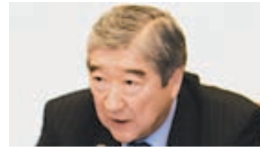
Тимур Мансуров Генеральный секретарь ЕвразЭС

Поэтому сегодня настал момент, когда бизнес-сообщество должно найти на площадке Евразийского Делового совета свое достойное место, чтобы более конструктивно наполнить конкретным содержанием эти успешные интеграционные проекты.