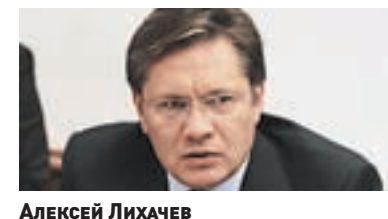
Алексей Лихачев Заместитель министра экономического развития РФ

Представители бизнес-сообщества, занятые в самых разных сферах деятельности, должны активнее участвовать в работе Евразийского делового совета, энергично пользоваться этой площадкой для формирования повестки дня будущих бизнес-форумов, более эффективно использовать новые возможности, которые предоставляются Таможенным союзом и формируемое Единое экономическое пространство.