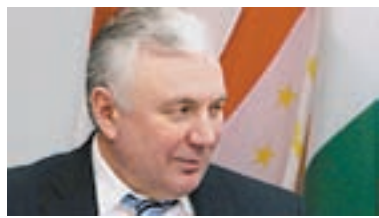
Олег Сосковец Президент Ассоциации финансово-промышленных групп России, председатель Координационного совета Евразийского Делового совета

Евразийский Деловой совет тесно работает со всеми структурами и институтами ЕвразЭС по содействию приоритетных программ и проектов, принятых главами государств Сообщества.