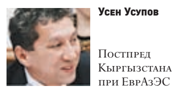
Усен Усупов Постпред Кыргызстана при ЕвразЭС

Мы также считаем, что необходим выход на отраслевой уровень для того, чтобы вся информация изучалась и учитывалась. У нас состоится неделя российского бизнеса, и мы договорились в рамках этой недели с участием трех сторон провести широкую дискуссию на тему нормативной базы строительства Единого экономического пространства. Эти инструменты не являются окончательными и далеки от совершенства, но трудно переоценить их важность. Мы считаем, что роль РСПП в рамках нашего ЕДС будет только возрастать.