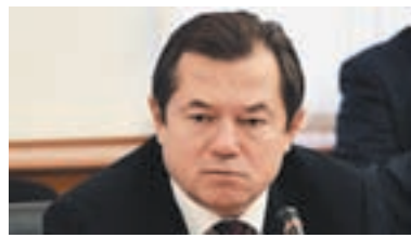
Сергей Глазев Заместитель генерального секретаря ЕвразЭС, ответственный секретарь КТС

Традиционно важным направлением в работе Делового совета является развитие интеграции в горно-металлургическом секторе. В 2010 году Деловой совет