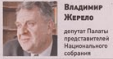
Владимир Жерело депутат Палаты представителей Национального собрания

Транспортные зря называют кровеносной системой экономики. Особенно это верно в эпоху глобализации, когда объемы перемещения товаров, материалов и производственных полуфабрикатов резко возрастают. Это наглядно видно на примере белорусской железной дороги, играющей важную роль в укреплении экономически взаимовыгодных контактов стран ЕвразЭС.