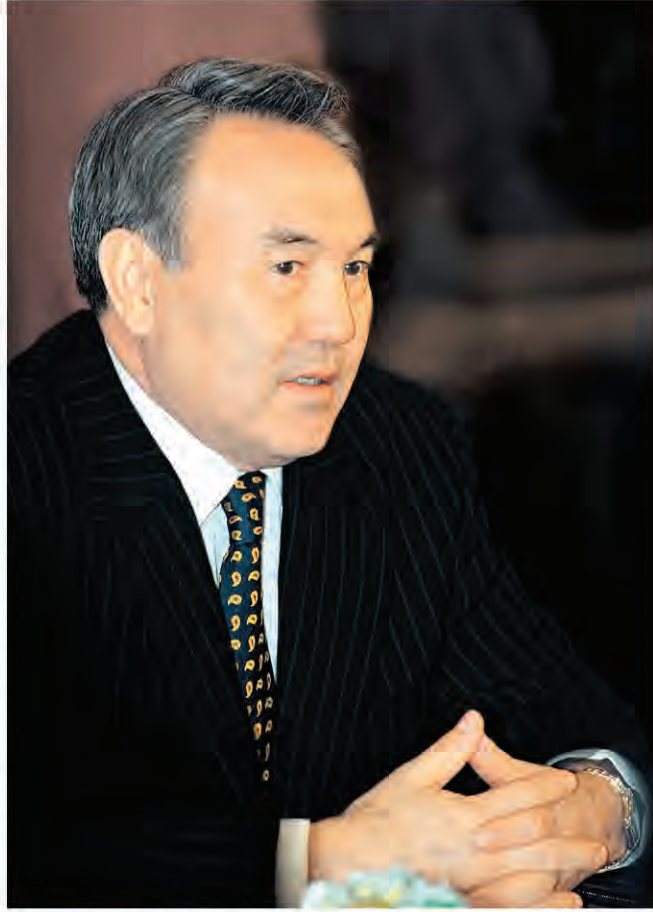
Президент Казахстана Н.А. Назарбаев в МГУ им. М.В. Ломоносова, 29 марта 1994 г.

Социально-экономический и политический кризис протекает на фоне многонационального состава населения практически всех государств