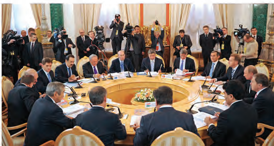
Межгосударственный Совет ЕвразЭС. Москва, декабрь 2012 г.

Выросли из его идеи Евразийский экономический союз – ориентир для всех, кто стремится занять достойное место в изменяющемся глобальном мире, чтобы благополучно и счастливо жить в обновленной Евразии.