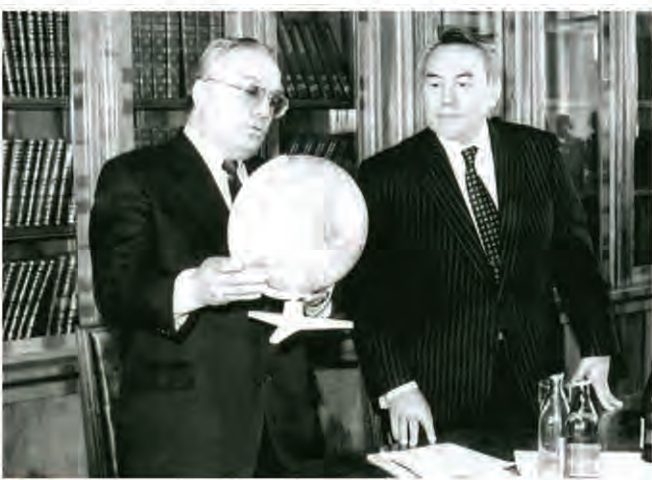
Н.А. Назарбаев и В.А. Садовничий, 29 марта 1994 г.

пользующих сформированный десятилетиями мощный интеграционный потенциал.